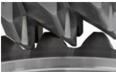
Зубофрезерование и зубофасочная операция