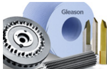
Инструмент для обработки с СОЖ и без