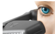
Сервис в режиме дополнительной реальности