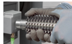
Связь инструмента со станком