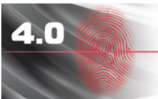
Плановое обслуживание с Fingerprint