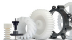
Пластиковые зубчатые колеса