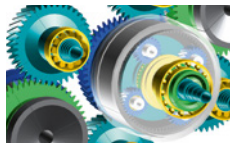
ПО KISSsoft для проектирования и производства зубчатых колес