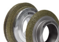
Правящий инструмент производства Gleason