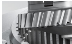
Power Skiving для наружных и внутренних венцов