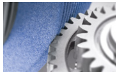
Контроль скручивания и полировочное шлифование