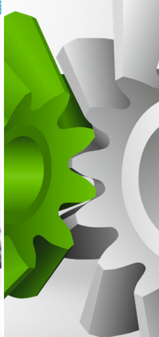
用于直齿锥齿轮的 Coniflex Pro